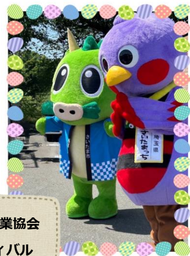
埼玉福祉事業協会 フェスティバル