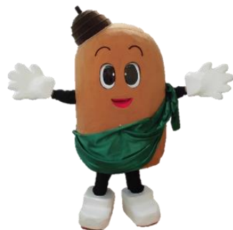
上尾かしの木特別支援学校のキャラクター「かっしー！！」

一歩一歩の幅も、歩む速度もそれぞれ違いますが、卒業後に自立し安心して生活できる力を養い、楽しく充実した人生を歩めるよう支援していきます。